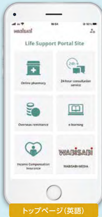
トップページ(英語)