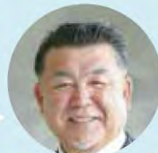
製造メーカー人事

導入することで外国人労働者の皆さんのモチベーションが上がりました。合わせて社内の労働環境も改善することができました。