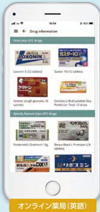
オンライン薬局(英語)