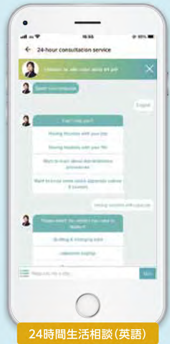
24時間生活相談(英語)