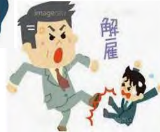
従業員を不当に解雇した