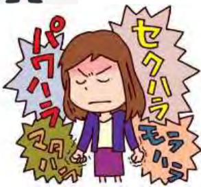
職場でのハラスメントで精神的なダメージを与えた