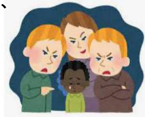
外国人労働者に対して、 雇用上不当な差別を行った