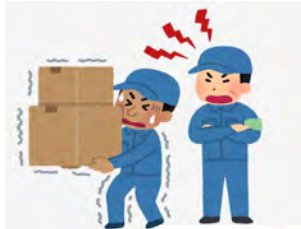
技能実習生に対して、 パワハラを行った

企業を取り巻く環境として、グローバル化の進展や、ダイバーシティ推進、フリーランスの活用等に伴い、企業における「雇用環境整備」の必要性が年々高まっています。また多岐にわたる「ハラスメント」が社会問題化し、雇用環境に対する社会の目も厳しさを増しています。